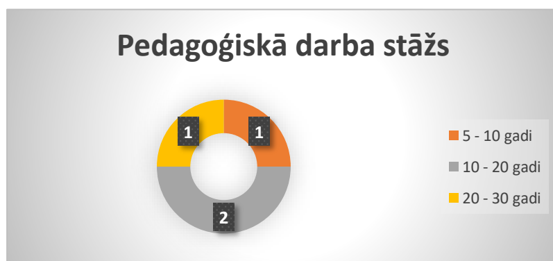
1.2. attēls. Pedagoģiskā darba stāžs

Pašlaik iestādē strādā 10 darbinieki, no tiem 4 pedagogi: vadītāja, mūzikas skolotāja, kā arī 2 grupu pedagogi. Skolotāji regulāri apmeklē profesionālās pilnveides kursus, visiem ir augstākā pedagoģiskā izglītība.